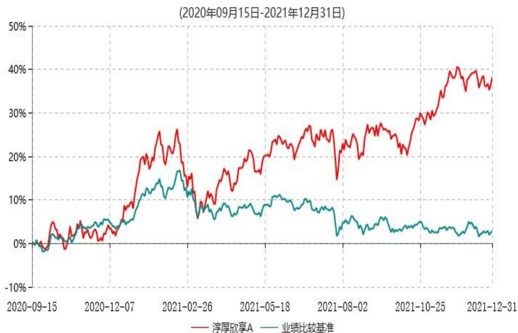
淳厚欣享A累计净值增长率与业绩比较基准收益率历史走势对比图

注：本基金基金合同生效日为 2020 年 9 月 15 日。按基金合同规定，本基金自基金合同生效起 6 个月内为建仓期。建仓期结束时本基金的各项投资比例均符合基金合同约定。